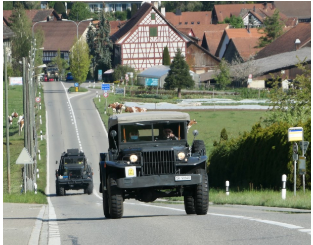
Dodge CC verfolgt vom Ward-la-France