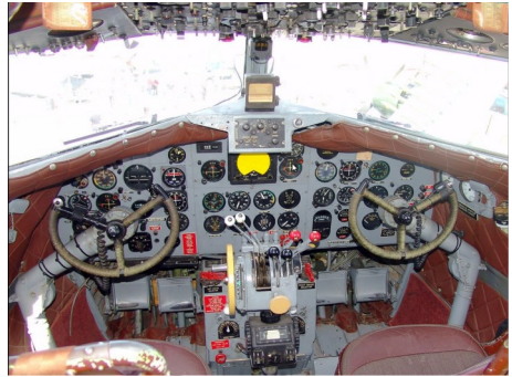
Das Cockpit der Dakota

An der Eröffnungsveranstaltung, die um 10 Uhr beginnt, wird sich auch die REGA präsentieren.