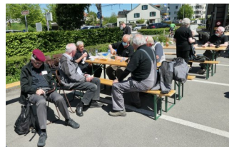
Zutrittskontrolle und Verpflegung