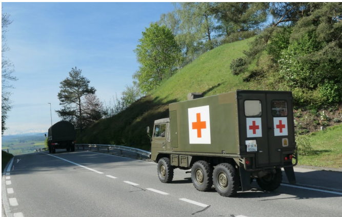
Auch der San Pinzgauer rollt ins Thurtal