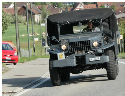
Dodge WC 6x6