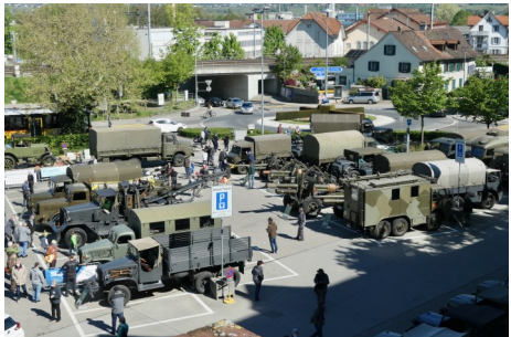
Fahrzeugaufstellung auf dem oberen Mätteli

Rund fünfzig Oldtimer — z. T. mit tonnenschweren Anhängelasten — vorschriftsgemäss, unfall- und pannenfrei und ohne unangenehme Verkehrsbehinderungen zu verschieben, ist eine recht aufwendige Sache.