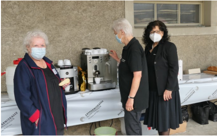
Beiz für Vorträge und Verpflegung gerüstet

Endlich wieder ein bisschen Normalität, endlich wieder ein Anlass mit Ansprachen, mit einem grösseren Publikum und mit offener Museumsbeiz!