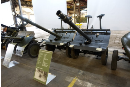
Geschütze im Museum am Rheinflall

Der Platz im KURIER lässt nur eine grobe Beschreibung dieser Geschütze zu.