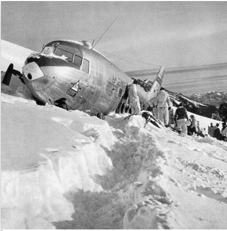
Die Dakota C-53 nach der Landung

lung stellt deshalb auch die historische Entwicklung und die heutigen Leistungen der Rega statt.