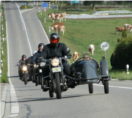
Die Spitze rollt an