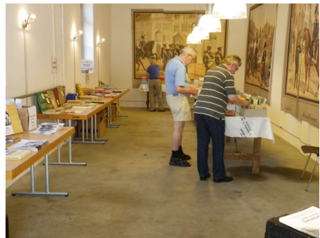
Stöbern nach Büchern, Reglementen und militärischer Ausrüstung