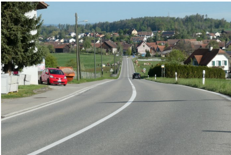
Oberneunforn in Erwartung des Korsos